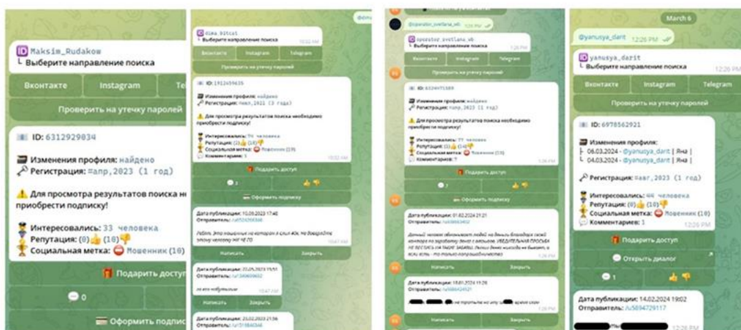
Рисунок 3 – пример мошеннической схемы

Есть другой вариант схемы: пользователь получает сообщение о том, что кто-то зашел в ваш аккаунт с другого устройства и необходимо подтвердить свои данные снова.