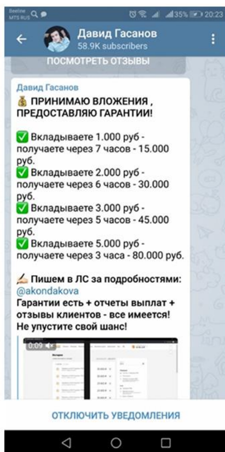
Рисунок 4 – пример предложения о криптовложении от мошенника

Telegram стал платформой для людей, интересующихся криптой. Многие мошенники стремятся получить доступ к криптокошелькам пользователей или предлагают воспользоваться «заманчивыми» услугами обогащения и вложения (рисунок 4).